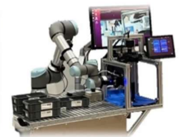
協働ロボットシステム

ナット締付装置/カシメ装置/反転装置/吸引装置 レーザーマーキング装置/リードカット装置 シール塗布装置/グリス注入装置/シャッフリング装置 パレット段積み装置・段バラシ装置 印字検査装置/嵌合検査装置/重量測定装置 寸法測定装置/傷検査装置/導通検査装置