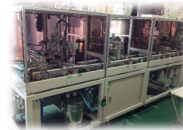
圧入/シーリング装置